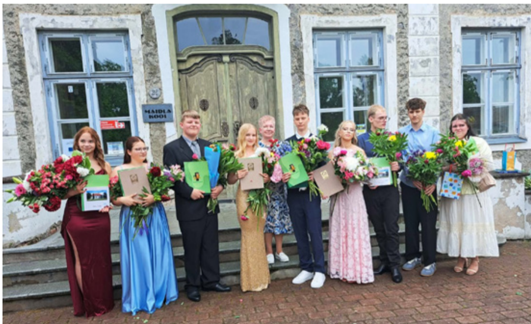
Выпускники Майдлаской школы.