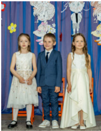
Детсадовская группа Linnupesa в Эрра.