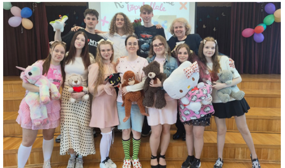
Выпускники Кивиыльской государственной школы.