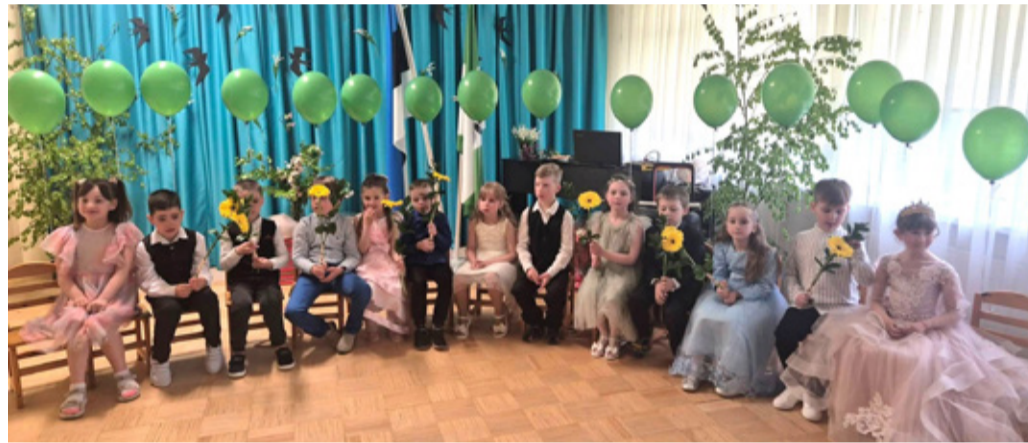
Группа Piibeht, детский сад города Кивийли Kannike.