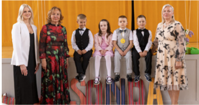
Детсадовская группа Puravikud в Сонда. 29 мая четверо смелых детей группы Puravikud отметили окончание детского сада и начало нового увлекательного пути. Также были выражены слова благодарности родителям за поддержку, доверие и прекрасное сотрудничество.