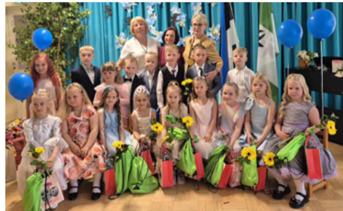
Группа Meelespea, детский сад города Кивийли Kannike.