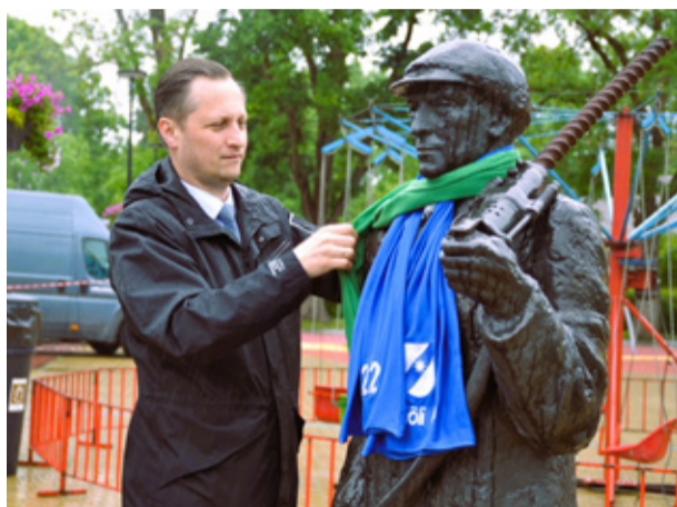
Следуя сложившейся традиции, волостной старейшина повязывает шахтёру на шею два шарфа: один — с бывшей символикой города Кивиыли, другой — с гербом волости Люганузе.

Следующий номер газеты выйдет 27 августа.