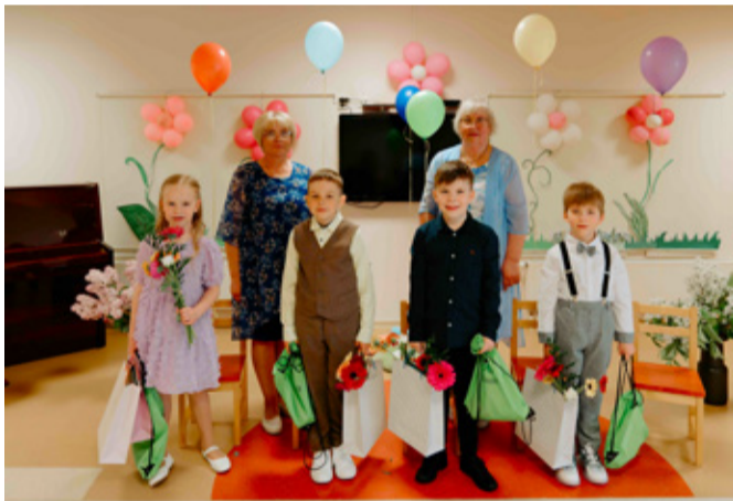
Выпускники детского сада Marjakese.