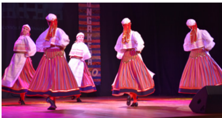
Выступление танцевальной группы Tuhkali.