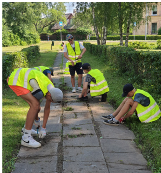
Участники дружины 2022 года за работой.