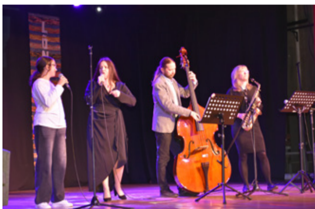
Ансамбль Кивиыльской школы искусств.

Вечер собрал многочисленных гостей, бывших и нынешних сотрудников, участников коллективов и любителей культуры. Зрители насладились танцевальной и музыкальной программой, подарившей много тёплых эмоций и незабываемых моментов. На протяжении десятилетий народный дом Кивиыли остаётся важным культурным и общественным центром, где сохраняются и передаются местные традиции, а также поддерживается самодельное творчество. Юбилейный концерт стал данью уважения всем, кто многие годы вносил