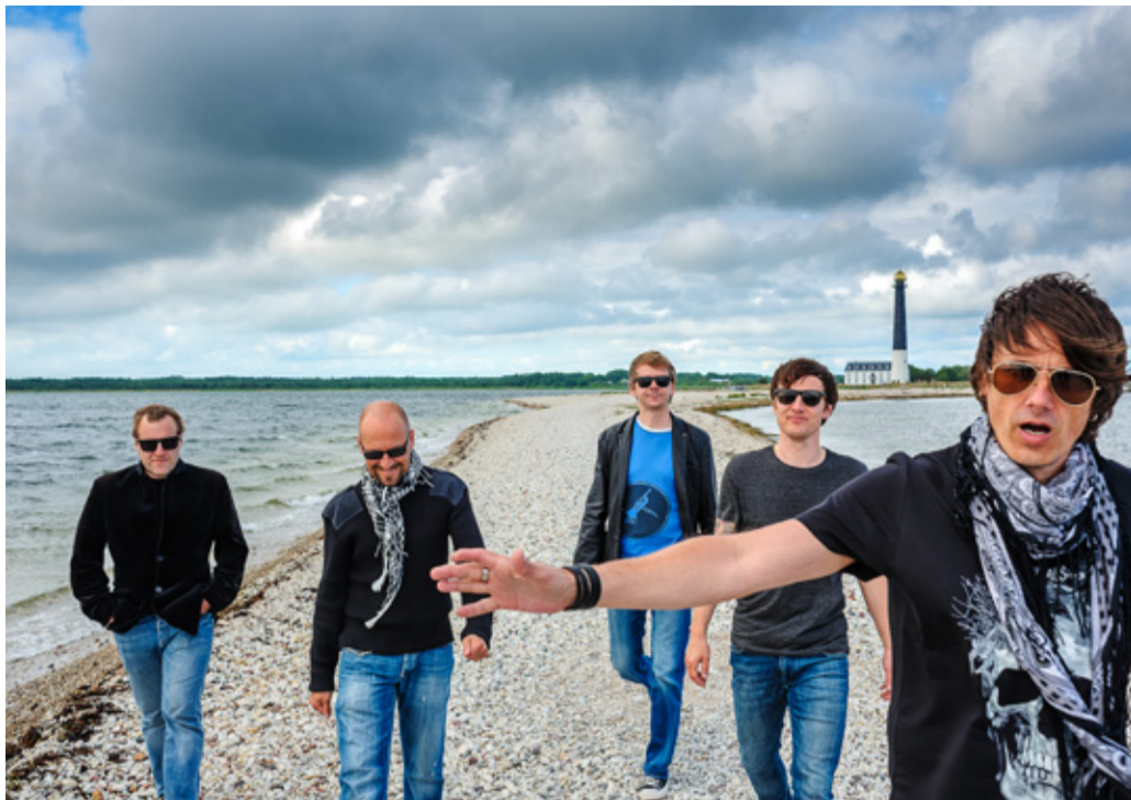
Главный исполнитель — группа Smilers