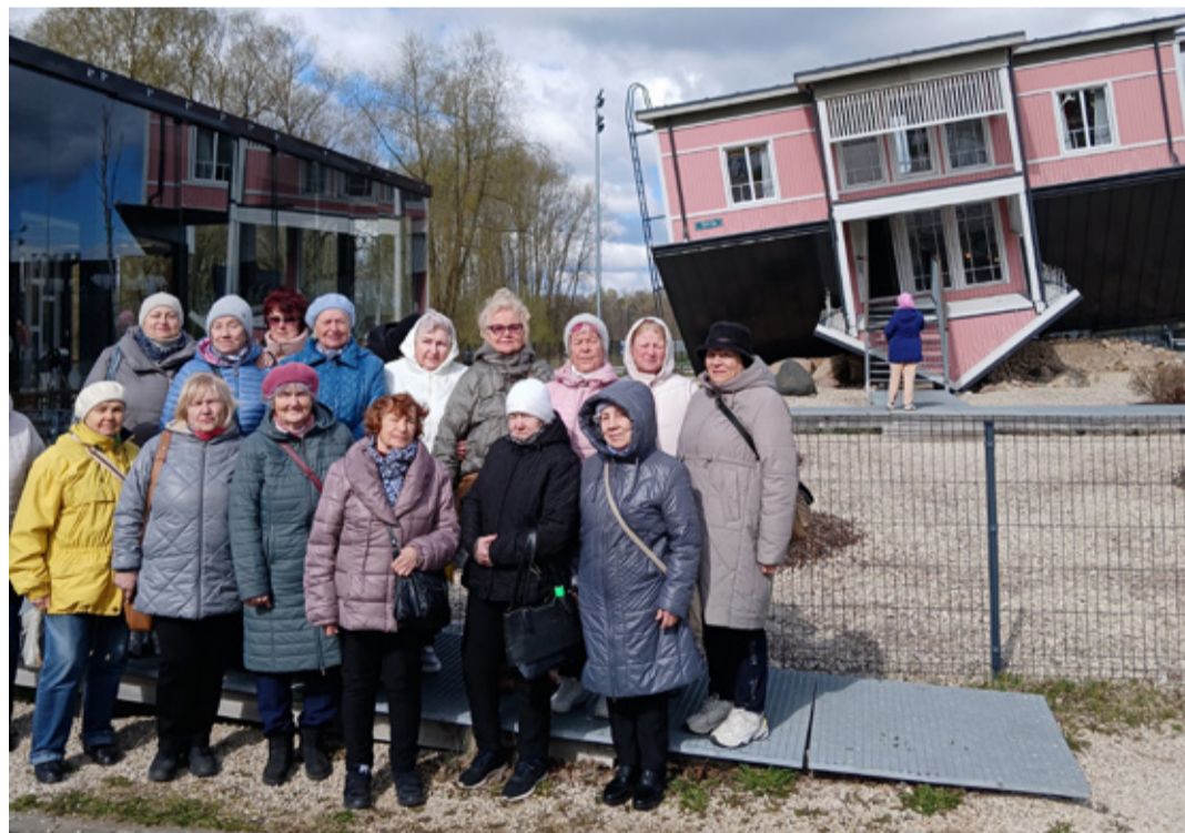
Фото: дневной центр Кивийли