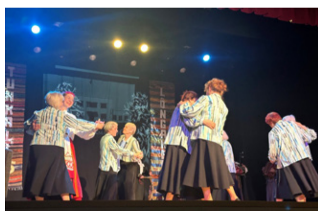
С танцевальным номером выступила танцевальная группа Lõngakera.