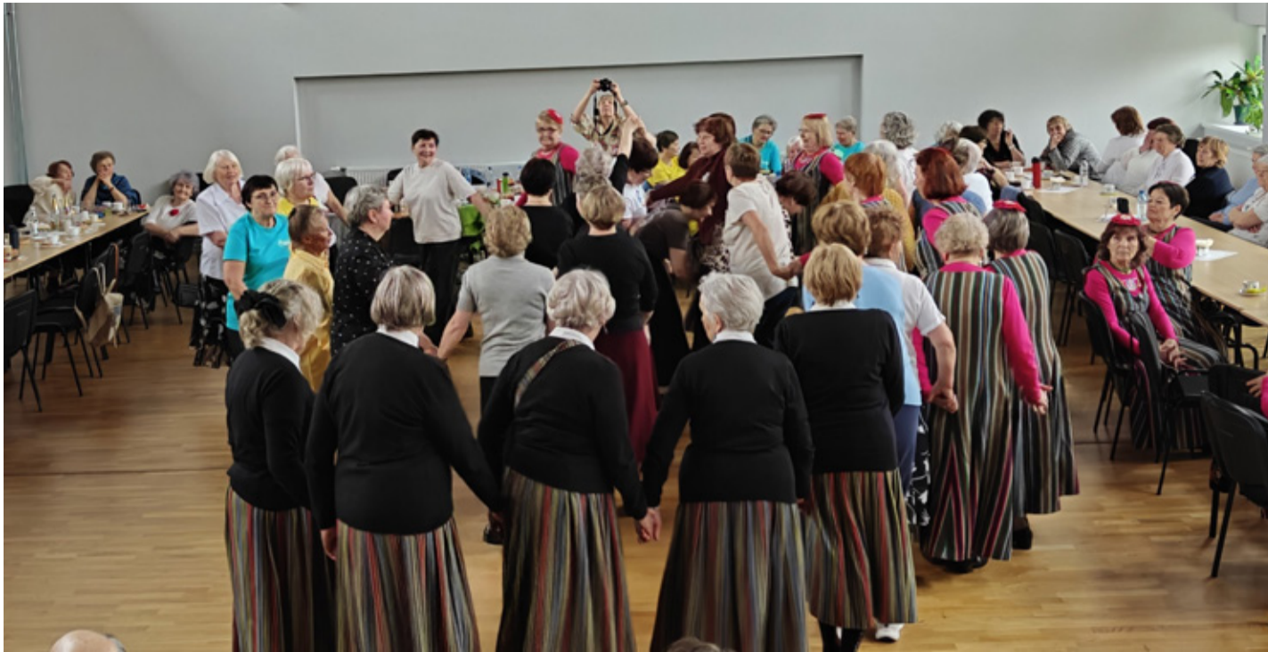
Фото: народный дом Сонда