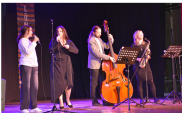
Kiviõli kunstide kooli ansambel.

Kontserdil sai nautida mitmekesist tantsu- ja muusikaprogrammi, mis pakus publikule palju sooje emotsioone ja meeldejäävaid hetki. Kiviõli rahvamaja on olnud aastakümneid oluline kultuuri- ja kogukonnakeskus, kus on hoitud ja edasi kantud kohalikke traditsioone ning