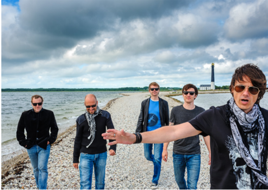
Peasineja ansambel Smilers.