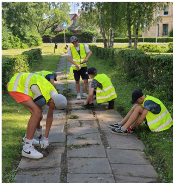
2022. aasta malevlased tööhoos