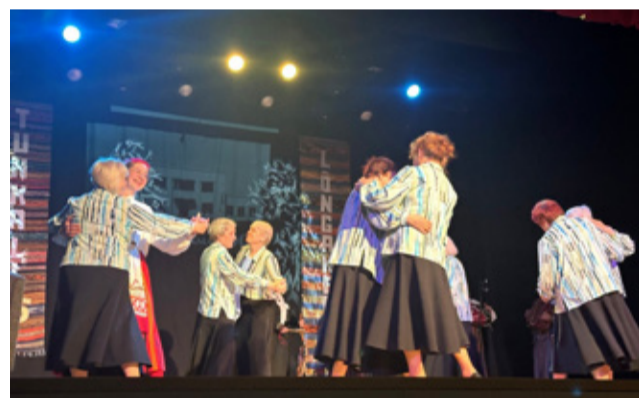
Tantsuga esines memmede tantsurühm Lõngakera.

toetatud isetegevust. Juubelikontsert oli südamluk kummardus kõigile neile, kes on aastate jooksul panustanud rahva-