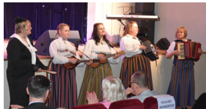
Muusikat tegi Lüganuse kapell.